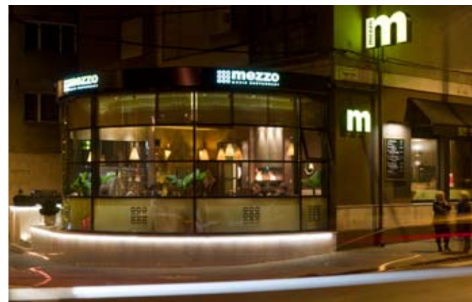
Gyarmati stílusú, pálmafás télikert látszik az utca felől

ART DECÓS, JAZZES HANGULATTAL NYITOTT ÚJRA NYÁRON AZ ÉVEK ÓTA FOGALOMSZÁMBA MENŐ MAROS UTCAI JOHN BULL PUB. AZ ÚJ STÍLUSRA A BERENDEZÉS MELLETT A NÉV – MEZZO – IS UTAL. A TÖRZSVENDÉGEIRE MÉLTÁN BÜSZKE HELYEN NEM VÁLTOZOTT AZ OTTHONOS, PADLÓSZŐNYEGES HANGULAT, DE A KORÁBBI ANGOLOS PUB KÖRNYEZETTEL SZEMBEN MOST AZ ÚGYNEVEZETT JAZZKORSZAK ATMOSZFÉRÁJA DOMINÁL.