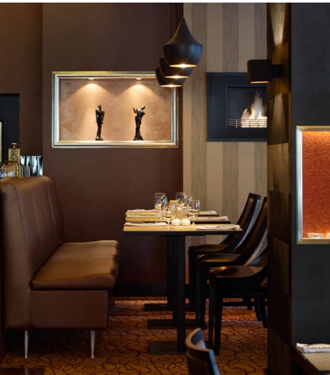
A visszafogott árnyalatoknak köszönhetően nem válnak zavarossá a tobzódó minták. Az enteriörbe belesimulnak a Basic Collection által szállított mobilíák

A régi korokat idéző, ruhatárral kiegészített, teátrális reflektor lámpával, leveles tapétával és süppedős fotellel berendezett, Hollywood aranykorát idéző, elkülönített belépő tökéletes izelítője az elegáns, az art deco elvein nyugvó belső térnek. Geometrikus formák határozzák meg az étkező részt, a szemet íves, hasonló vonalú álmennyezettel kiegészített bárpult vezeti, a teret szögletes, katonás rendbe állított oszlopok osztják, melyek kijelölik az asztalok és székek rendezett sorának helyét. Az ívek és szögletek kontrasztja adja a berendezés alapritmusát, amit a harmincas évek stílusára jellemző fekete és arany színek, ornamentals minták, súlyos drapériák és fényes, rezes részletek egészítenek ki. A visszafogott, rokon árnyalatoknak köszönhetően nem válnak zavarossá az egymás mellett tobzódó csíkok, indák és levélminták sem.