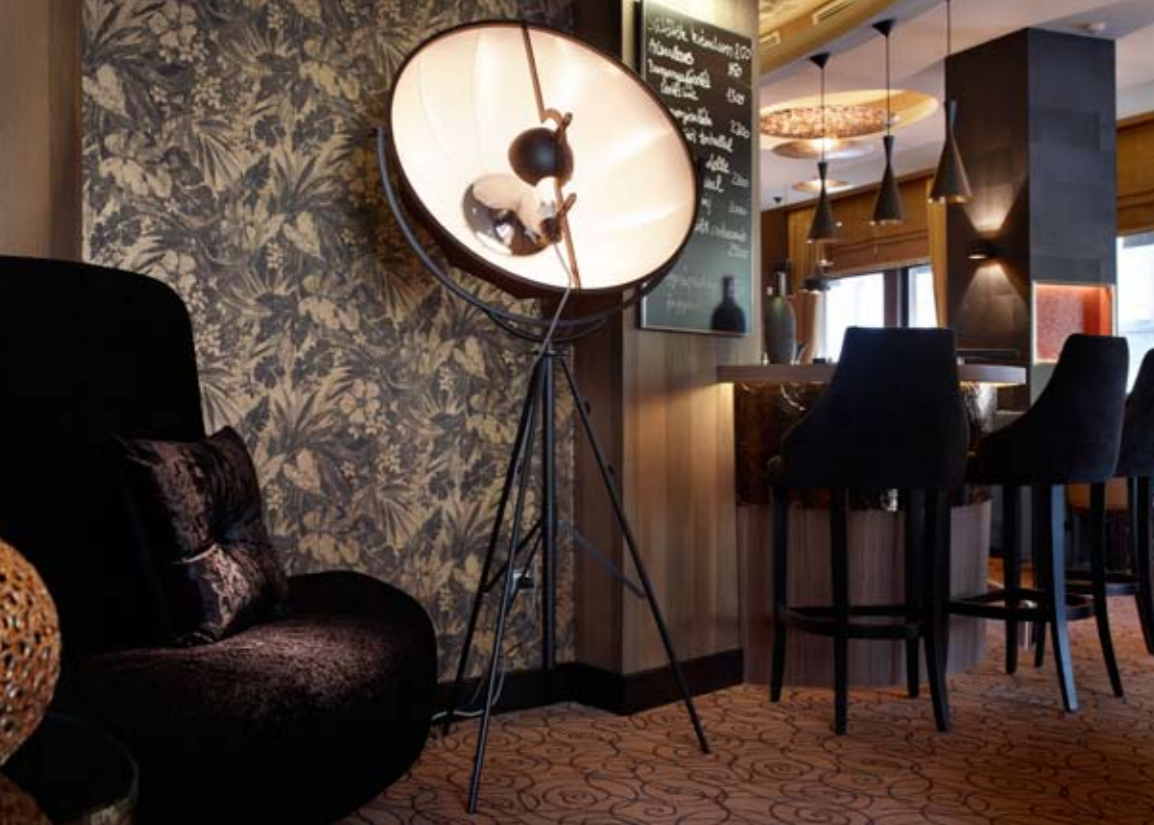
A teátrális belépő tökéletes izelítője a fő térnek. A különböző terek hangulatát a világítás erősíti, a Solinfo lámpáival